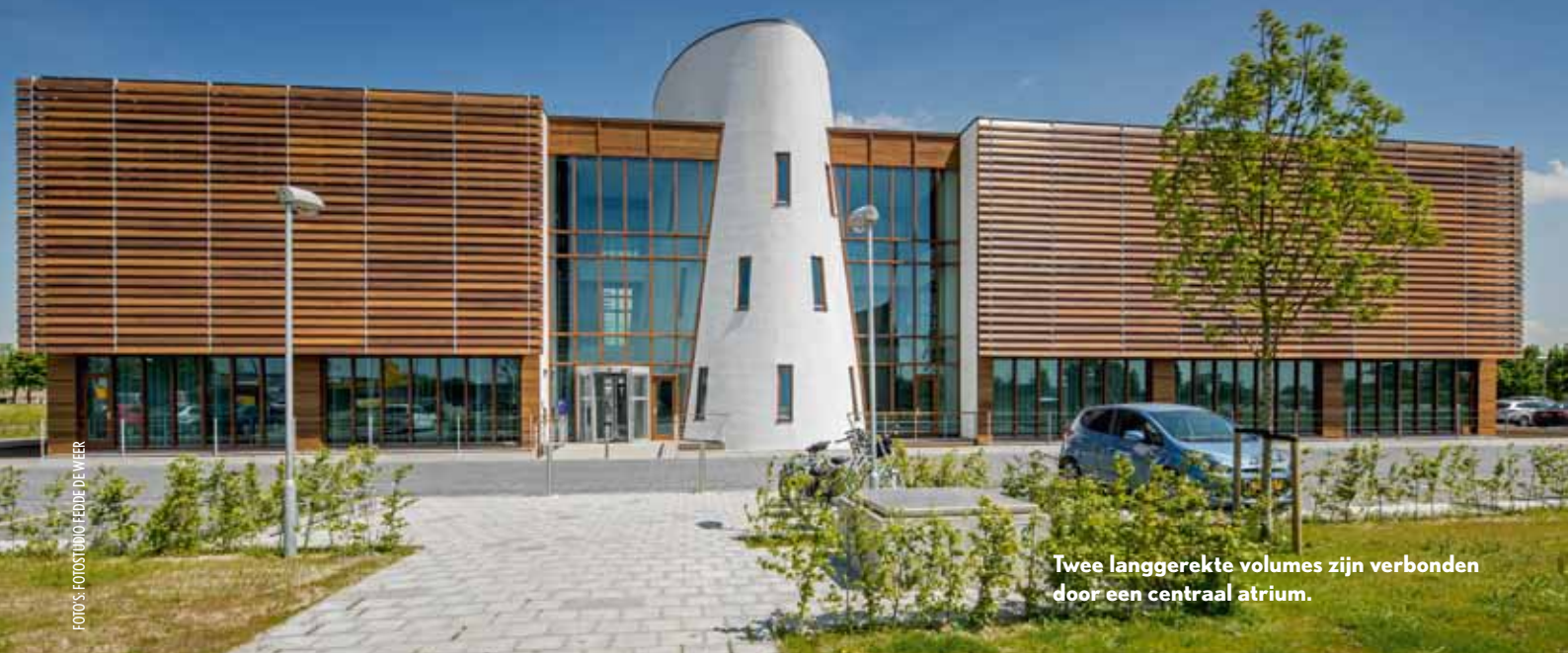
Twee langgerekte volumes zijn verbonden door een centraal atrium.