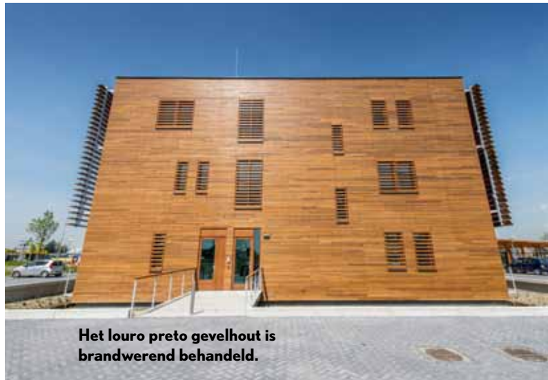
Het louro preto gevelhout is brandwerend behandeld.