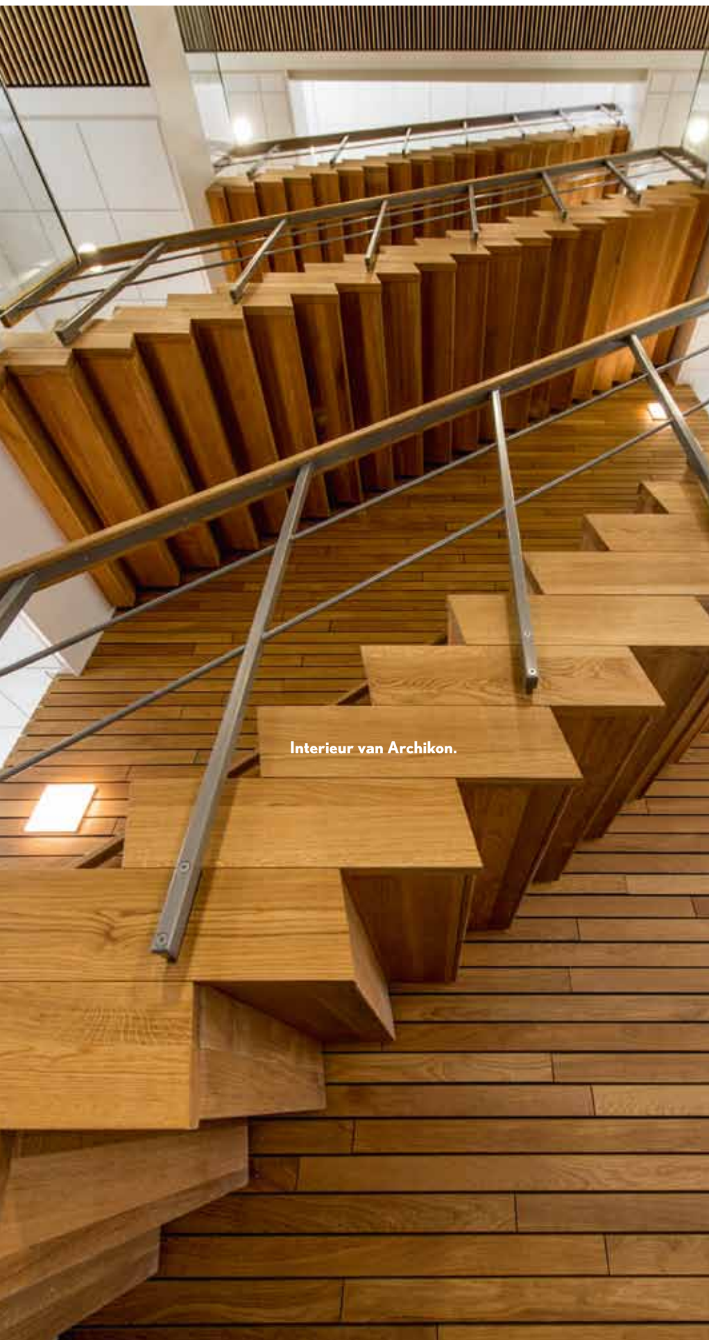
Interieur van Archikon.