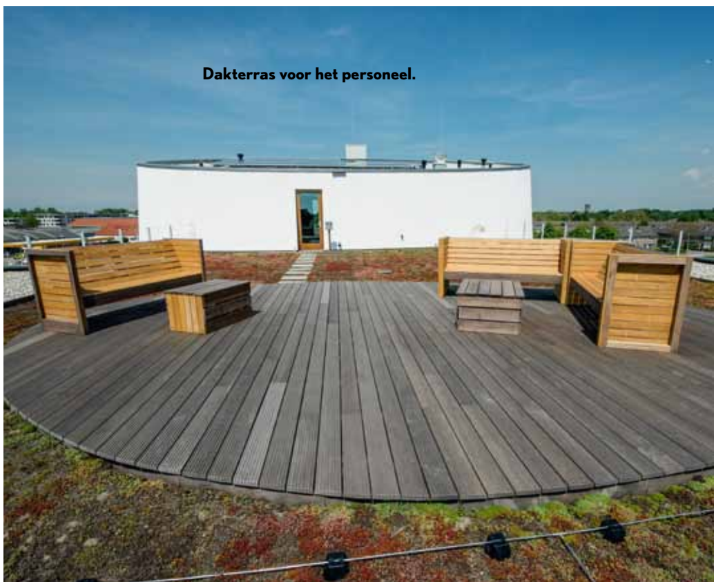
Dakterras voor het personeel.

Voor de interieurbetimmeringen werd samengewerkt met Harry Westhoeve Keuken- en Interieurbouw in Ouddorp. Deze firma voerde betimmeringen uit in FSC-gecertificeerd berkenmultiplex dat met HPL is beplakt. Alles - waaronder kasten, meubilair en keukens - is met de hand gemaakt. ■