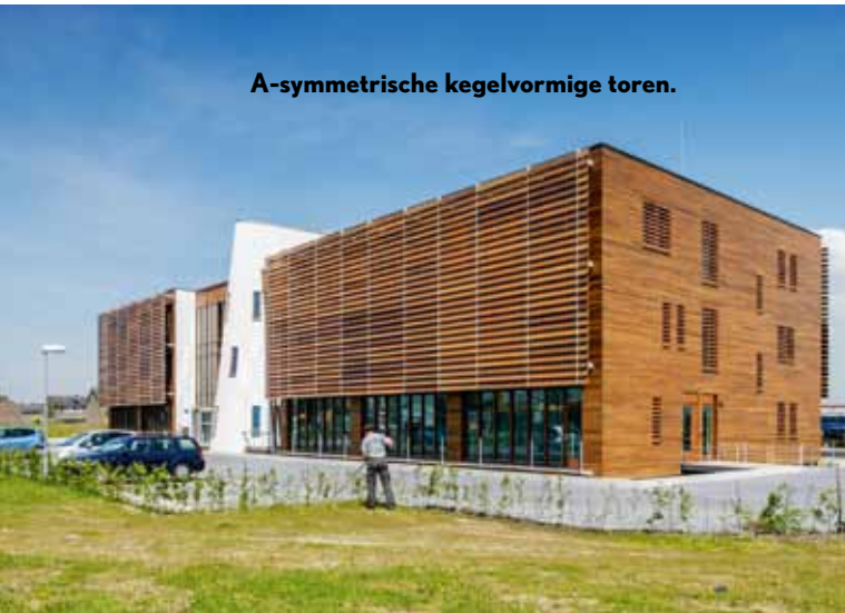
A-symmetrische kegelvormige toren.